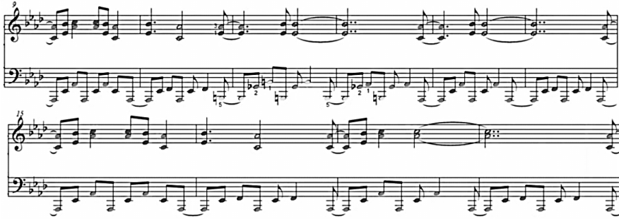
شكل رقم (٧) يوضح النموذج اللحني السابع.

النموذج السابع : موسيقى بإسم (Peanuts) من أفلام تشارلي براون ( Charlie Brown) عام ١٩٤٦م.