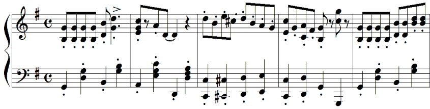
شكل رقم (١) يوضح النموذج اللحني الأول.

النموذج اللحني الأول : موسيقى (تركيا في سترو) ( Turkey in the Straw ) من فيلم (ستيمبوت ويلي) ( Steamboat Willie ) عام ١٩٢٨م ، وهو لحن أيرلندي قديم ، وموسيقى الأغنية الشعبية الأمريكية المعروفة بعنوان (تركيا في سترو) ( Turkey in the Straw ) قامت ديزني بوضع أساساً للموسيقى التصويرية وتطويرها ، وذلك بإستخدام الألحان العامة ، الإيقاعات ، والمؤثرات الصوتية المتزامنة مع الأداء الأوركسترالي ، وكانت الموضوعات الموسيقية الرئيسية التي أدخلها المؤلف الموسيقي ويلفريد جاكسون .