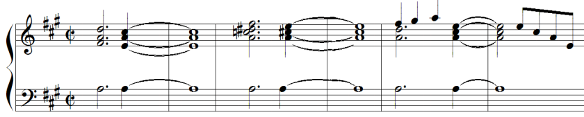
شكل رقم (١٠) يوضح النموذج اللحني العاشر.

بُنيت الصياغة اللحنية لهذا النموذج في مقام مي/bك في ميزان 2^2 إستخدم في هذه الصياغة تآلفات الدرجة (I - V7) في شكل تبادلي لليدين مع وجود نغمات منفردة في اليد اليسرى وتآلف الدرجات في اليد اليمنى. النموذج العاشر : أغنية (مفاجأة سيمور) (Suddenly, Seymour) من فيلم (متجر الأوهال الصغير) (The Little Shop of Horrors) عام ١٩٨٦م.