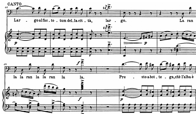
شكل رقم (٤) يوضح النموذج الحني الرابع.

بُنيت الصياغة اللحنية لهذا النموذج في مقام فا/ك في ميزان 4/4 ، وقد إستخدم المؤلف فيه تآلفات الدرجة (VI) في اليدين في صورة نغمات منفردة لليد اليسرى ، ومسافة (٤ت) في اليد اليمنى بشكل تبادلي في اليدين ، كذلك هو الحال في تآلف الدرجة (VII7) ، الدرجة (IV7) ، وإستخدم مسافات (٦ص ، ٦ك) ، وتآلف الدرجة (L V9 - IV - V7) من سلسلة النموذج الحني الرابع : أريا (خارج إلى فاكتوتم)(Largo Al factotum) من سلسلة أفلام بيجز بانى بعنوان (Bugs Bunny In Long Haired Hare) عام ١٩٤٩م ، والتي أظهر من خلالها مبادئ القيادة الموسيقية للأوبرا بمصاحبة الأوركسترا ، ومرة أخرى بمصاحبة البيانو في بعض المشاهد ، وقدرة المغني الأوبرالي في أداء النغمات الحادة بصورة ساخرة ومضحكة.