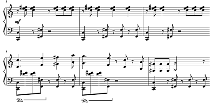
شكل رقم (٥) يوضح النموذج اللحني الخامس.

النموذج اللحني الخامس : موسيقى أفلام كارتون عائلة سيمبسون ( The Simpsons ) عام ١٩٨٩م ، هي موسيقى لأغاني ساخرة تنتقد سلوكيات عائلية.