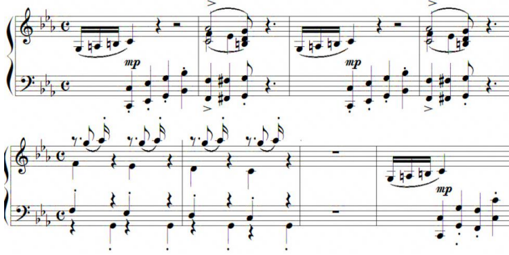
شكل رقم (٢) يوضح النموذج اللحني الثاني .

النموذج اللحني الثاني : (السمفونية السخيفة) ( Silly Symphony ) من فيلم (رقصة الهيكل العظمي) ( The Skeleton Dance ) عام ١٩٢٩م ، وهو واحد من أعظم ٥٠ فيلم للرسوم الكارتونية بُنى فكرته على أربع هياكل عظمية ترقص حول مقبرة مخيفة ، وتعزف موسيقى بعض الأعمال الأوركسترالية.