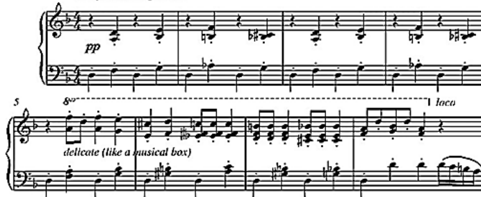
شكل رقم (٣) النموذج اللحني الثالث.

عام ١٩٤٠م ، وهو فيلم للرسوم المتحركة ذات التقنية العالية ، والأوبرا التقليدية الذي نال إعجاب شعبي حاسم وعالمي لقطاع عريض من الجماهير في أواخر الثلاثينيات ، والجدير بالذكر أن موسيقاه عُزفت بواسطة أوركسترا فلادلفيا ( Philadelphia Orchestra).