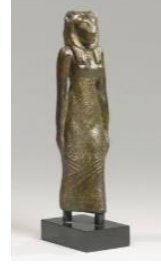
(شكل 8) الآلهة سخمت . برونز (1) (شكل 9) تمثال أبو الهول .حجر كلسي. أمام أهرامات الجيزة ( 2 )

التي أرسوها وفقا للفكر المصرى القديم وكونت اسلوبا خاصا لهم تتطور مع الحقب الزمنية التي حكموا فيها البلاد ، وكانت معظم تلك التماثيل توضع في مداخل المدن والقصور لاعتقادهم بأنها تحمى من الشرور المنظورة وغير المنظورة وكانت غالبا بوضع الجلوس ومن أشهرها أبو الهول (شكل 9)