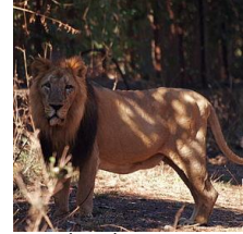
(شكل1) أسد آسيوي (2)