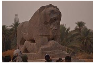
(شكل13) زوايا رؤيا مختلفة لأسد بابل. (2)