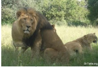
(شكل3) أسد إفريقي(2)

ثانياً : الصياغات التشكيلية لنحت عنصر الأسد في الحضارات القديمة . يعد الأسد Lion من السننوريات، وفيما مضى " كان الأسد الحيوان الأكثر انتشاراً بعد البشر، وتواجد في معظم أنحاء إفريقيا، وأوروبا الغربية إلى الهند(1)" أ-التأثير البيولوجي للأسد: تختلف الأسود الآسيوية عن الإفريقية من عدّة نواحي "فهي أصغر حجماً ، ولذكورها لبدة أقل كثافة من الأسود الإفريقية وتتميز الأسود الآسيوية بسلوكها الاجتماعي، ولعلّ السبب في ذلك يعود إلى أن هذه الأسود شاطرت موطنها مع عدد من القبائل لآلاف السنين، مما جعلها تعتاد وجود البشر على مقربة منها" (2) ويتميز الأسد بعضلات قوية، وبكتلة عظام قليلة نسبياً مقارنة بحجمه، كما أنّ عضلات جسمه الأمامية تمتاز بقوة تمكّنه من توجيه ضربة بأطرافه الأمامية، يستطيع بها شقّ ظهر حيوان ضخم مثل الحمار الوحشيّ كما يتميز بحاسة شم تمكّنه من معرفة وجود فريسة بالجوار، بل وتحديد وقت تواجدها في ذلك المكان. كما أنّ حاسة الإبصار لدى الأسد تفوق مثيلتها عند البشر بخمسة أضعاف. كما يمكن للأسد سماع صوت الفريسة على بعد ميل(3). كما هو مبين في (شكل1،2،3)