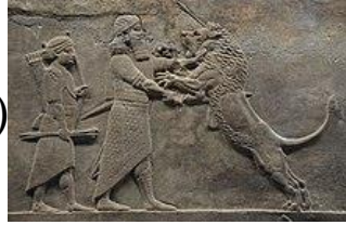
(شكل 11) جزء من أسد مهاجم من آشوربانيبال 645-635 ق.م.(3)

كانت بمثابة اللغة المتداولة، التي مكّنت الفكر الانساني على أرض الرافدين، ان يوثق ما لديه من خبرات وأحاسيس" (1) فيلاحظ استدعائه عناصر من بيئة الطبيعية المحيطة به ،وأكسبها دلالات فكرية ثقافية عن طريق التفاعل بين ظاهر العنصر وجوهره من ناحية ، ودلالاته الموجودة بالجانب الإجتماعى له ، بفعل القوة الرمزية والتحرير من الخاصية المادية.(شكل 11) "تظهر الأسود نابضة بالحياة والتفاصيل الطبيعية. إنها أفضل أعمال النحت البارز الآشورية".(2) ويمثل موضوعها الإنتصارعلى قوى الشر وتظهر الملك حاميا لشعبه ورعيته إضافة لإستعراض قوته وبأسة، بما يبث فيهم أيضا فكرة الخضوع