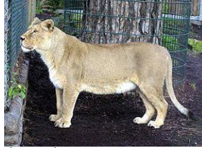
(شكل2) ليوة. أنثى الأسد (2)