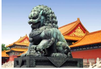
(شكل19) أسد فو الحارس . برونز . المدينة المحرمة ماو بالصين بساحة ثيانانمن . بوابة السلام السماوى الأسد (1)

المانعة لدخول قوى الشرّ سواء أكانت بشرية أو إلهية حيث السهر على رعاية الباب وحمايته وكذا الحفاظ على وقار الإمبراطور، ولهذا كانت رمزا للقوة (شكل19) وهو عبارة عن أسد جالس، منتصب اليدين مرتكزا عليهما إضافة لأرجلة الخلفية وقد وضع يديه على أسد صغير بوضع حركي مقلوب. على قاعدة على شكل متوازي مستطيلات وقد زينت ببساطا مربعا مزخرفا تتدلى زواياه جانبي القاعدة المزخرفة بدورها أيضا .