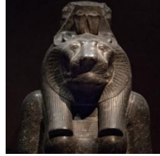
(شكل ٦) الآلهة سخمت . جرانيت أسود (1)

أ- تمثال المعبودة سخمت Sekhmet . عبارة عن تمثال واقف بجسد إمرأه ورأس لبؤة ترتدى الفستان الشفاف أو المذهب وهو رداء الملكات ، فى الوضع الحركى للمشى بهدوء حيث إمتداد القدم اليسرى إلى الأمام والإرتكاز على القدم اليمنى ممسكة بأحد يديها مفتاح الحياة وترتدى فوق رأسها غطاء راس الملوك وقد برزت الأذنين منه ، ويعلو الوجه ملامح الحزم والهيبة والتريص (شكل ٦) . وأحيانا يعلو رأسها قرص الشمس الدائرى أو الثعبان رمزاً للملك ، أو لاشئ .