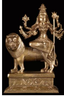
(شكل ١٨) دورغا . نحاس (١)

بالرغم من تشكيل أنياب للأسد إلا أنه الصياغة العامة للشكل تفقده مفهوم الشراسة ليتبدى في حالة من الهدوء يوحى بالفخر .