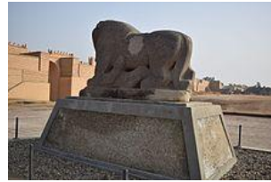
(شكل ١٤) (٢)