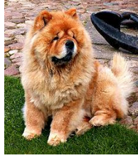
(شكل18) كلب تشاو تشاو الصيني (٢)

أ-تماثيل الأسد فو Foo برزت فكرة الأسود عندما عاد التجار البوذيون ، إلى بلادهم من الهند وقد تحاكو عن حراسة الأسود للمعابد هناك ، فقام النحاتون بعمل تماثيل لكلاب مستأنسة من أصول صينية(شكل18) تشاو تشاو* Chow Chow لوضعها على بوابات البيوت والمعابد الصينية بما أن أحدا منهم لم ير أسدا من قبل ومنذ أن أصبح الأسد حاميا للدارما الهندية ، فقد تبدى للصينيين أن يجعلوا من تلك الحيوانات حماية وحراسة البوابات للامبراطور ، ومنذ ذلك الحين تم استخدامها لهذا الغرض ولإعتقادهم بأن الشرور تسير في خطوط مستقيمة.