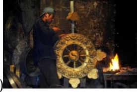
(شكل ١٦) الدارما شاكرا (1)

عندها الدلالات الثقافية لفكر المجتمع الهندي فإن المتأمل لمفهوم الدائرة والنقطة المركزية في ضوء الفلسفات الشرقية القديمة " الدائرة هي رمز الكون، والنقطة هي رمز الكائن الأعلى الذي يحمي ويغذي تلك الدائرة. تبتعد النقطة المركزية بنفس المسافة عن كل نقاط الدائرة، وبهذا تحافظ على توازنها. تحدث كل عمليات التكوين والحياة في المسافة ما بين المركز ومحيط الدائرة." (2) مركز الكون بأكمله هو الإله الأكبر. يرسل المركز النور والحكمة باتجاه المحيط ويرسل المحيط المحبة باتجاه المركز. عند لف الدائرة تتمحور حول نقطة مركزية. تلك النقطة التي يحكم فيها السلام. فإن مركز الدائرة هو إسقاط إفتراضى لقمة مخروط والقمة تعني الأعلى، التسامي والتصاعد كما تعطي معنى الواحد المكتمل .