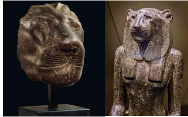
(شكل ٧) أجزاء تفصيلية.الإلهه سخمت (٣)

الأسد وهى ربة الأوبئة والرياح الساخنة الصحراوية القائلة لذا سماها المصريون بأنفاس سخمت .ولكن عملية الدمج أضافت بعدا آخر حيث كانت أيضا ربة الحماية والشفاء للملك خصوصا فى الحروب فقد كانت له كأمة .لذا فهى إضافة رمزية لتضادين متداخلين متوازنين، فكما ازداد أحدهما عن حد معين، بدأ يظهر الآخر، كما أن في داخل كل واحد منهما إمكانية التحول للآخر، "وكان من بين الحفريات التي اكتشفت بالقرب من القدس رسائل من الطين عددها ٣٨٢ لوح تطلب فيه امرأة ترتدي زي الملوك التنسيق بين مملكتها وبين مملكة فرعون في مصر للقضاء على اللصوص وقطاع الطرق والمتمردين وكان التوقيع في آخر كل رسالة طينية ، سيدة اللبؤات"(١) ٤- إختيار وتشكيل عنصر الإنسان بجسد المعبودة سخمت حيث تعبيرة عن المبادئ العليا عند المصرى القديم وهى الروح النفس العقل والقلب ولكى يكون لها وجود مادي واقعى فلا بد من الإرادة وهى المتمثل فى معنى الإنسان أى اتحاد المادة وهنا يصبح معنى تمثيل جسد الإنسان فى الفكر المصرى القديم هو الألوهة المتظاهرة على الأرض،"ومن هنا كان دور الإنسان الأساسى وما يميّزه عن كل الكائنات الأخرى هو إعطاء معنى وقدسية للحياة ورفع مستوى المادة".(2)