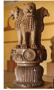
(شكل ١٥) أجزاء تفصيلية. أسود أشوكا . متحف فارانسي سارنات في الهند