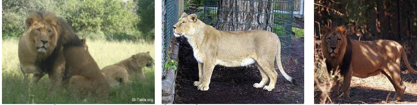
(شكل ١) أسد آسيوي (٢) (شكل ٢) لبؤة. أنثى الأسد (٢) (شكل ٣) أسد إفريقي (٢)

ثانياً : الصياغات التشكيلية لنحت عنصر الأسد في الحضارات القديمة . يعد الأسد Lion من السنوريات، وفيما مضى " كان الأسد الحيوان الأكثر انتشاراً بعد البشر، وتواجد في معظم أنحاء إفريقيا، وأوروبا الغربية إلى الهند(١)" أ-التأثير البيولوجي للأسد: تختلف الأسود الآسيوية عن الإفريقية من عدة نواحي فهي أصغر حجماً ، ولذكورها لبدة أقل كثافة من الأسود الإفريقية وتتميز الأسود الآسيوية بسلوكها الاجتماعي، ولعلّ السبب في ذلك يعود إلى أن هذه الأسود شاطرت موطنها مع عدد من القبائل لآلاف السنين، مما جعلها تعتاد وجود البشر على مقربة منها" (٢) ويتميز الأسد بعضلات قوية، وبكتلة عظام قليلة نسبياً مقارنة بحجمه، كما أنّ عضلات جسمه الأمامية تمتاز بقوة تمكّنه من توجيه ضربة بأطرافه الأمامية، يستطيع بها شقّ ظهر حيوان ضخم مثل الحمار الوحشيّ كما يتميز بحاسة شم تمكّنه من معرفة وجود فريسة بالجوار، بل وتحديد وقت تواجدها في ذلك المكان. كما أنّ حاسة الإبصار لدى الأسد تفوق مثيلتها عند البشر بخمسة أضعاف. كما يمكن للأسد سماع صوت الفريسة على بعد ميل(٣). كما هو مبين في (شكل ١،٢،٣)